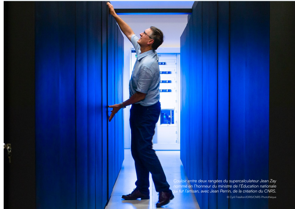
Couloir entre deux rangées du supercalculateur Jean Zay nommé en l'honneur du ministre de l'Éducation nationale qui fut l'artisan, avec Jean Perrin, de la création du CNRS.