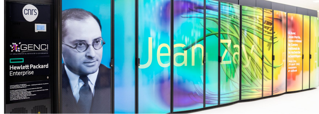
Le supercalculateur Jean Zay permet d'étendre les modes d'utilisation classiques du calcul de haute performance (HPC) à de nouveaux usages pour l'intelligence artificielle (IA).

Constatant que les méthodes et outils de l'IA pénètrent désormais l'ensemble des champs scientifiques et soulèvent de nombreux enjeux scientifiques, éthiques et sociétaux, le CNRS a créé le centre AI for Science and Science for AI (centre AISSAI). Son objectif est de structurer le dialogue entre les différentes communautés scientifiques autour de l'IA. À travers des outils comme l'organisation de semestres thématiques, l'invitation de chercheurs étrangers et un programme de fellows, le centre AISSAI a pour